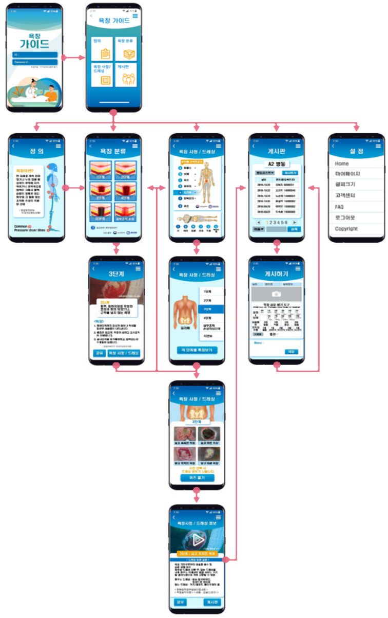
Figure 3. User flow of the 'Pressure Injury Guide' mobile application.

루어진 연구이기에, 본 연구에서 채택한 방법은 비교적 단시간에 소수의 인원으로 특정 사용자들을 위한 모바일 앱 사용자 인터페이스를 구현하고자 하는 연구자들이 활용할 수 있는 방법일 것으로 사료된다.